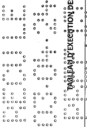
TABLEAU D'EXECUTION DU BUDGET PRINCIPAL ET DES BUDGETS ANNEXES